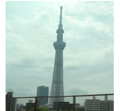
登りたかったなスカイツリー