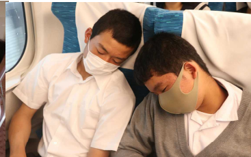
夢の中で再び夢の国へ