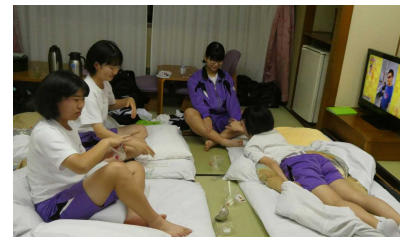
まくら投げで惨敗…