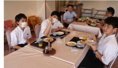
ババアが好きなものを好きにだけ