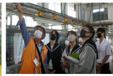
富岡製糸場の工場見学