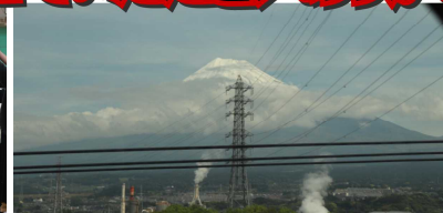
新幹線の車窓から富士山