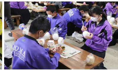
やればできる！その集中力