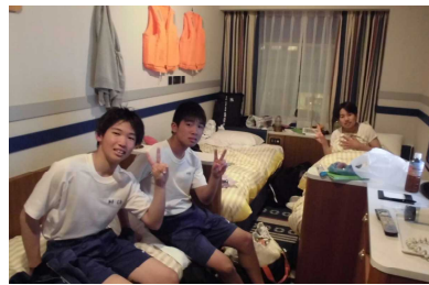
船をコンセプトにした部屋