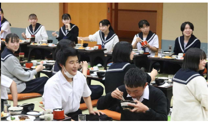
成人式も楽しみな宴会力！