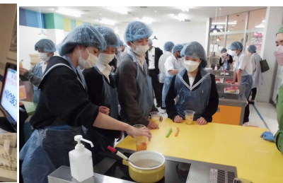
初めての調理実習