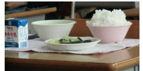
モリモリ食べてスタミナUp!

2年生の元気の源は、なんだろうといつも考えています。家族、仲間、勉強、部活動、睡眠、趣味…。もちろん人によって違いますが、今回は「食事」にフォーカスしてみると、昨年よりも給食を食べる量が増えたのではないのでしょうか。1年生の時は、半分近く減らしていた人も今では配膳された量を食べられるようになっています。この蒸し暑い季節に関わらず、たくさん食べられる食欲に関心しています。量が食べられるということは、それだけ内臓が活発に動いている証拠。