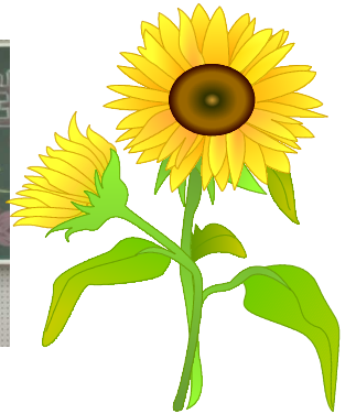
感謝の会の生徒代表の言葉