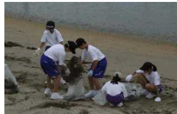
海草を拾って袋へ