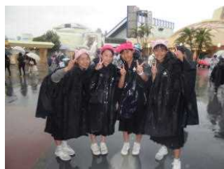
雨のディズニーにて