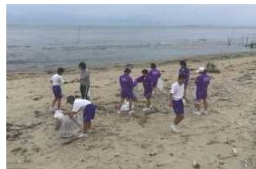
砂浜のゴミを拾っています

私は海岸清掃を終えて気づいたことが2つあります。1つ目は、3年間やって気づいたことですが、落ちているものはビニール袋やストロー、ペットボトルなどのプラスチックが多いということです。ビニール袋は亀などの動物がクラゲとまちがえて食べてしまったりするので、少しでも少なくしなければいけないゴミだと思います。プラスチック製品は軽くて飛んでいきやすいので自分もなるべくもらわないようにするか、飛んでいったりしないように気を付けたいです。2つ目は、1年で海岸はずいぶんゴミがたまってしまうということです。去年すごくきれいにしたのに1年たつとやっぱりたくさんゴミがあって掃除しがいがありました。なのでこれからもずっとこの行事を続けてほしいです。