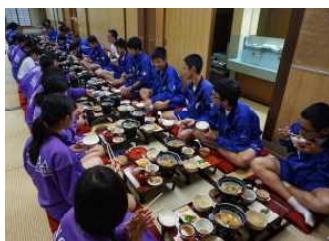
旅館の大広間で食事