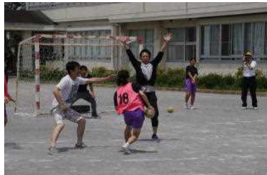
親子でゲームをしました

朝から各地域のごみゼロ運動に参加した後、多くの保護者の皆様に、授業参観をしていただきました。その後のふれあいタイムでは、どの部でも保護者と生徒が笑顔で活動しており、大変貴重なふれあいの場となりました。