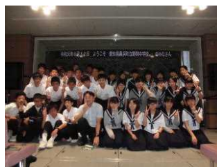
B組 交通管制センター見学

初日は、国会議事堂を見学して、午後からはディズニーリゾートへ。ランドとシーへ班の希望で入り、雨の中でしたが、生徒はみんな大はしゃぎで楽しいひとときを過ごしました。夜は旅館の大広間で全員いっしょに夕食をとりました。2日目は班別研修を行いました。NHKや新聞社、裁判所、博物館、出版社など、事前に班で計画した場所を訪れました。スカイツリーで集合してホテルへ行き、夕食をいただきました。3日目は学級別研修でA組は警視庁、B組は交通管制センターへ行った後、国立劇場で合流して歌舞伎を見ました。3日間を通して、仲間との絆を深めるとともに、官庁や企業の見学から自分の将来について考えることができました。