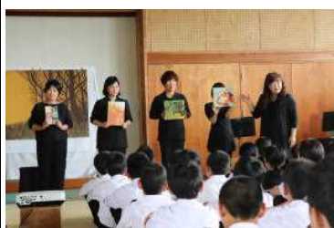
ブックパフォーマンス

「海の子文庫」の皆さんに武道場で1年生へブックパフォーマンスをしていただきました。ことば