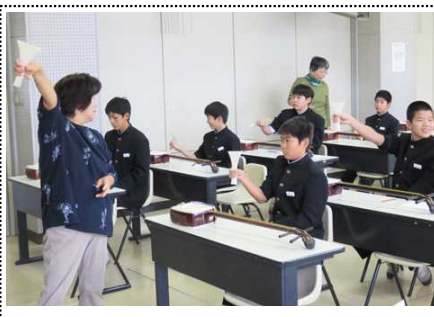
ハチの持ち方を習っています