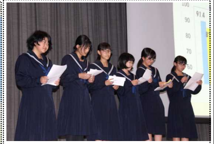
睡眠時間を確保するために早く寝ることが大切