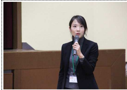
愛知健康プラザより