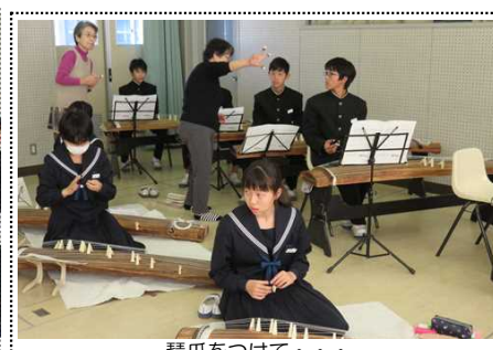
琴爪をつけて・・・