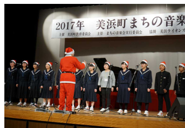
歌を披露する合唱部の生徒

「美浜町まちな音楽会」に、合唱部の生徒が参加しました。日頃の練習の成果を発揮し、美しい歌声を届けることができました。