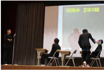
劇を披露する保健委員の生徒

「元気なからだをつくるには～感染症予防について～」をテーマに、保健委員が、生徒の生活についてアンケート結果をもとに検証したり、劇を交えてウィルスの脅威を伝えたりしました。