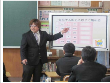
「税金には様々な種類があります」

半田税務署より講師をお招きし、税の種類やその特徴について教えていただきました。税金の役割やその重要性を知ることができました。