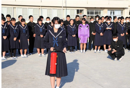
消火訓練をする生徒