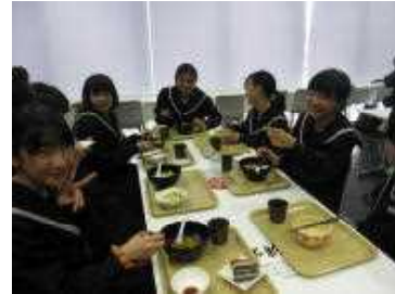
上級学校訪問後に日福大で昼食

上級学校訪問を目的として校外学習を行いました。自分たちの進路実現に向けて、たくさん学ぶことができました。