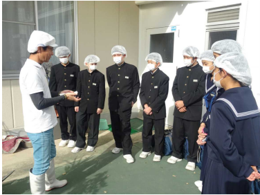
企業を訪問し、説明を聞く生徒

1年生は半田市の企業や事業所を見学しました。実際に働く人の話を聞くことで、仕事の大変さややりがいを感じるとともに、将来について考える機会となりました。