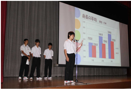
保健委員会による発表の様子