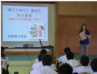
生徒が書いた七夕短冊

栄養士の先生による食の指導が行われました。毎年各学年1回行われます。今回3年生では、市販の弁当を栄養面から見直す活動をしました。健康のためのよりよい食事を考えるよい機会となりました。