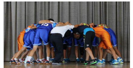
ハンドボール部顧問も入って円陣