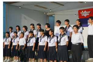
観客を前に堂々と歌う合唱部

野間の花火大会にて、合唱部による発表が行われました。屋外ということもあり、合唱部の人数だけでは声量が足りません。そこで、多くの生徒が協力して、会場を盛り上げました。