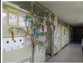
教室前の七夕飾り

校長先生が朝会で各学級に七夕の笹を配りました。全校生徒と先生が短冊に思い思いの願いを書きました。学級のさらなる団結を願うもの、郡大会でのよい結果を願うものなど生徒の思いが伝わるものばかりでした。