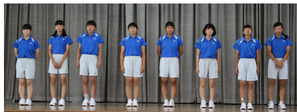
意気込みを発表するソフトテニス部女子