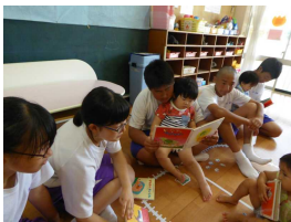
優しく読み聞かせ

2年生は、家庭科で野間保育所を訪れました。幼児の笑顔に、生徒は普段見せないような「おにいさん・おねえさんぶり」でした。楽しく遊ぶ中で、細やかな心遣いで接することの大切さを学びました。