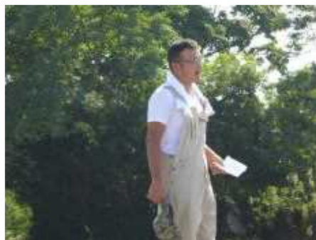
説明する武田PTA環境整備部長