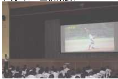
郡大会での活躍を紹介する校長