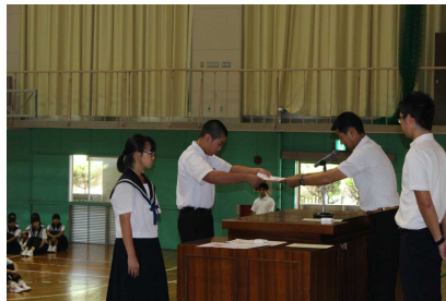
郡大会での表彰を受ける生徒

8月1日に、夏季休業に入って最初の全校出校日がありました。校長先生の話では、各部活動の知多地方体育大会での活躍が画像を交えて紹介され、生徒は真剣に話を聞いていました。この長い休みを部活動や勉強など有意義に使い、2学期からも元気に活躍することを期待しています。