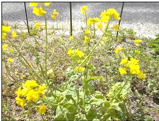
花がさいている様子