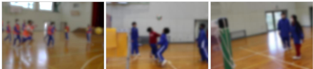
2A「ポインポインパス」

「どうすればみんなで楽しめるのか」ということをよく考えた内容だったこともあり、みんなの歓声が体育館に響いていました。