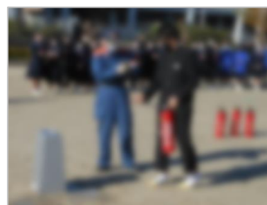
初期消火が重要です