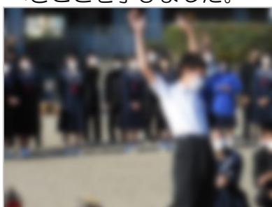
「火事だ!」と周りに知らせよう

11月14日(月)に、火災避難訓練が行われました。「おはしも」を守って無事に避難した後、2年生は消火器体験をしました。消防士さんの話を真剣に聞きながら、初期火災の時にすべきことを学びました。