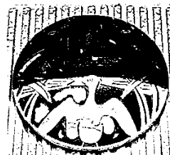
美浜町立上野間小学校の校章

愛知県的美浜町立上野間小学校では、カワウが校章のデザインに使われています。また観光地では、カワウが観光PRのマスコットキャラクターとして活躍しています。このようにカワウは化学肥料の出現により糞採取が行われなくなった後も、美浜町の人々にとって身近な鳥として親しまれ、現在でも町のシンボルとして愛されています。(木村)