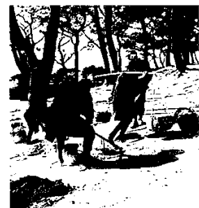
カワウの糞を採取するようす