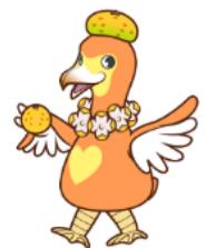
上野間小マスコットキャラクター 「ゆうみたん」