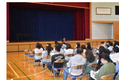
【P T A総会】